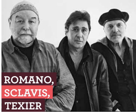
ROMANO, SCLAVIS, TEXIER

El italiano Aldo Romano y los franceses Louis Sclavis y Henri Texier, son definidos a menudo como patriarcas del jazz europeo. Sin embargo, lejos del adocenamiento de otros, siguen conectados a una energía creativa más propia de sus hijos e, incluso, nietos.