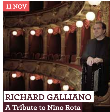
RICHARD GALLIANO A Tribute to Nino Rota

Richard Galliano es un erudito de la memoria musical del acordeón. A punto estuvo de diluirse en la orquesta del vocalista Claude Nougaro, si no es porque el patriarca argentino Astor Piazzolla le hace reflexionar acerca de las posibilidades de su técnica. Desde entonces, Galliano es un intérprete irreductible, un músico que investiga en la elegancia y en la sutileza del sonido, un creador que no ha cedido un ápice de sus compromisos musicales en los últimos veinte años.