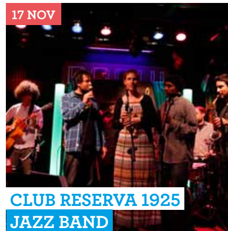
CLUB RESERVA 1925 JAZZ BAND

Un heterogéneo grupo formado por músicos muy exigentes llegados desde todas las esquinas del país; desde A Coruña a Granada, pasando por Zaragoza y con estación de término en Madrid.