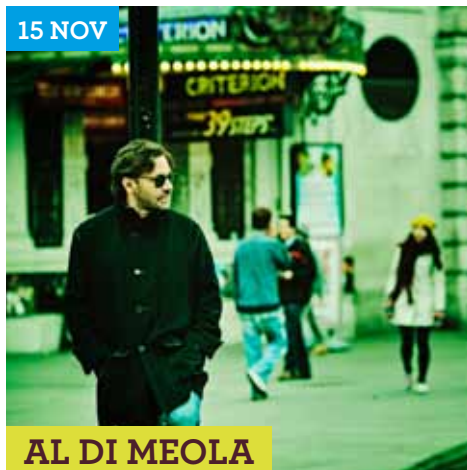
AL DI MEOLA

La irrupción de Al Di Meola en la interpretación guitarrística de los cuarenta últimos años constituye un hecho singular. Tras su paso por el Berklee College de Boston, contactó muy pronto con Barry Miles y, poco después, Chick Corea lo reclutaba para su Return to Forever. Esta banda proporcionó a Al Di Meola una poderosa argamasa con la que seguir edificando su carrera en lo sucesivo.